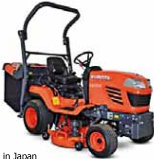
Made in Japan

KUBOTA G231LD Modell 2025 (23 PS), Hydrostat, 19 km/h ab € 21.990,--