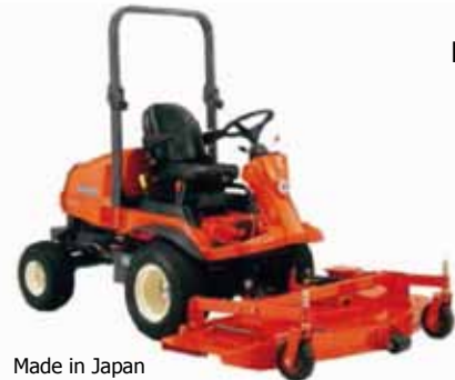
Made in Japan