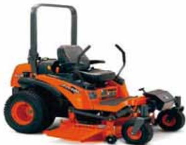
Made in USA