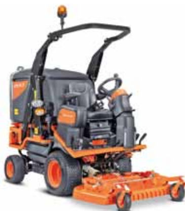
Made in Italien