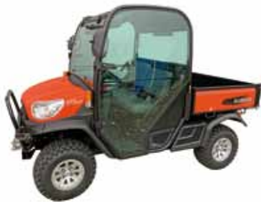
Made in USA

KUBOTA RTVX1110 (25 PS), 3-Zylinder Diesel, inkl. StVZO, inkl. Dach, 3-stufiger Hydrostat, 40 km/h