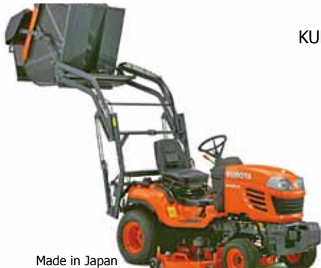
Made in Japan

KUBOTA G231HD Modell 2025 (23 PS), Hydrostat, 19 km/h ab € 26.990,--